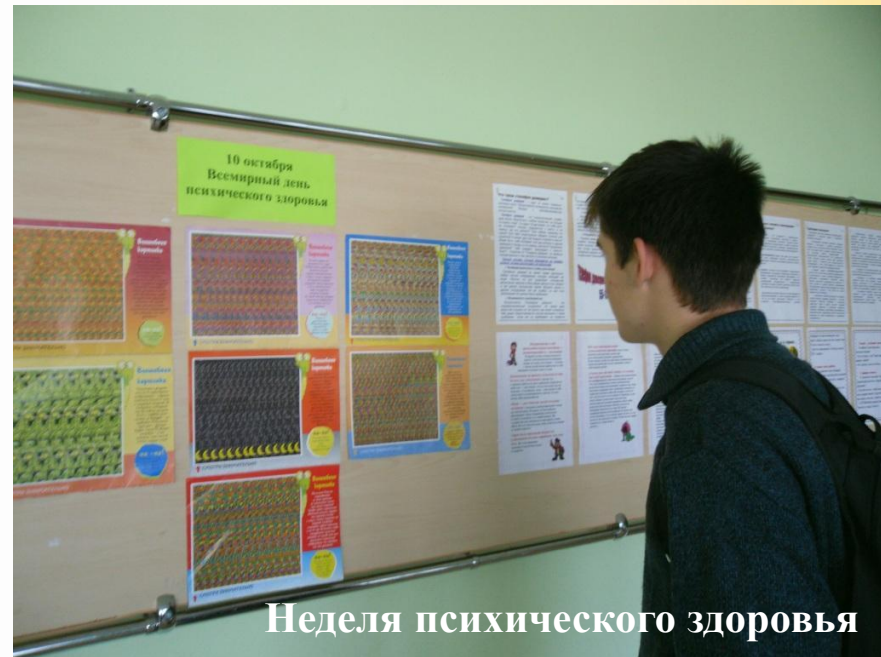
Неделя психического здоровья