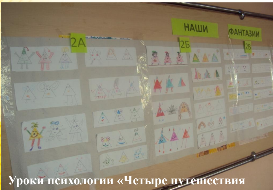
Уроки психологии «Четыре путешествия»